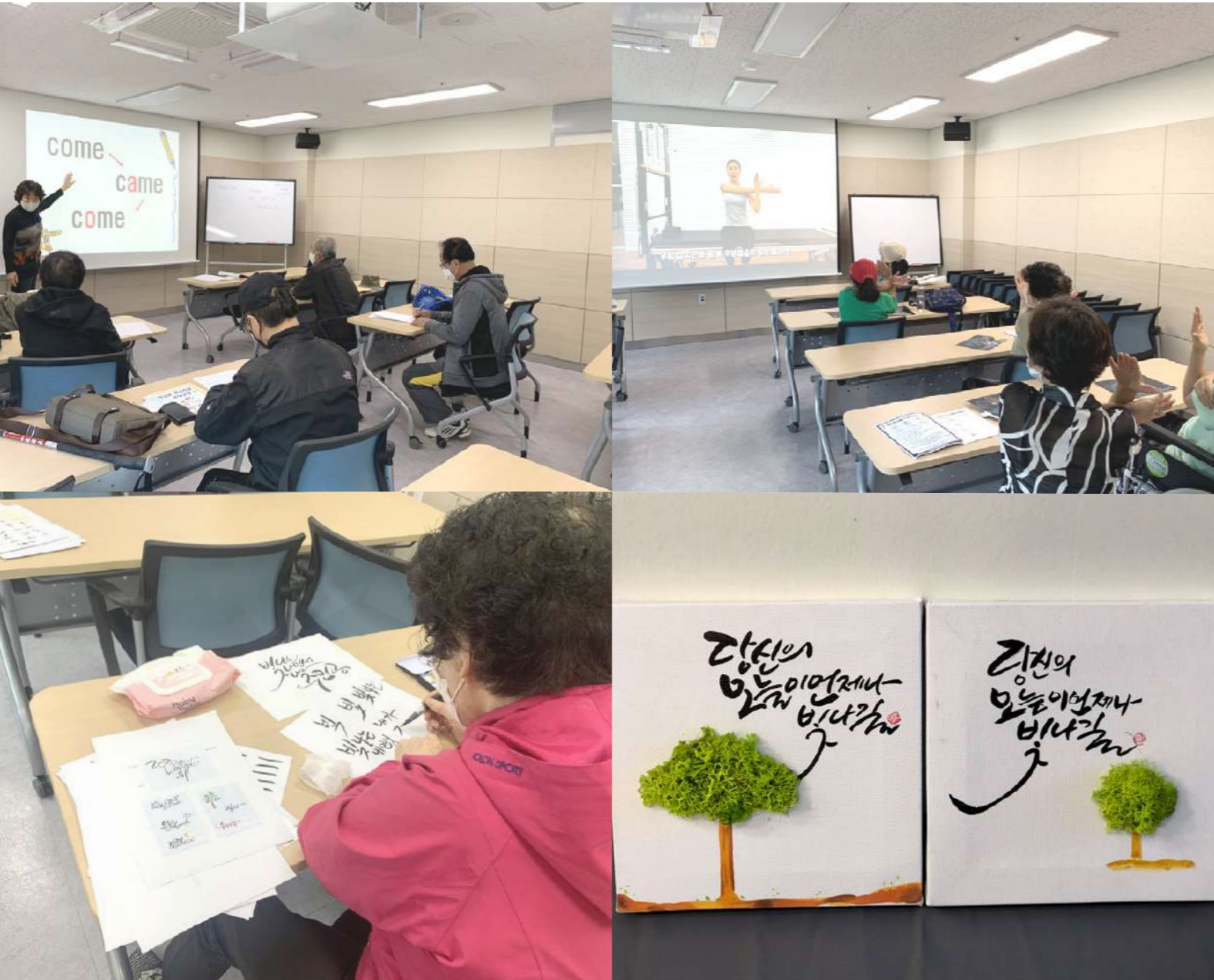
1 2 ① 어르신들과 함께하는 영어교실 ② 프로그램 후 스트레칭 시간 ③ 캘리그래피 교실 ④ 캘리그래피 작품 3 4