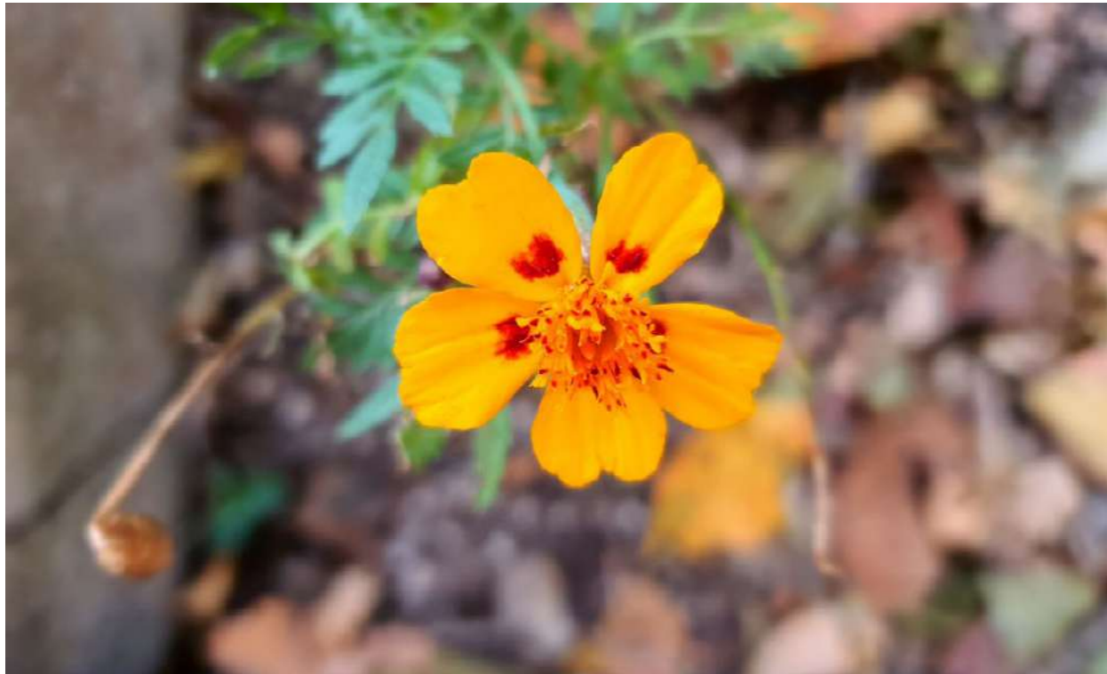
문화예술지원사업 '우리가 만드는 초점 : 포커스' 사진 촬영 프로그램 자원봉사자의 작품