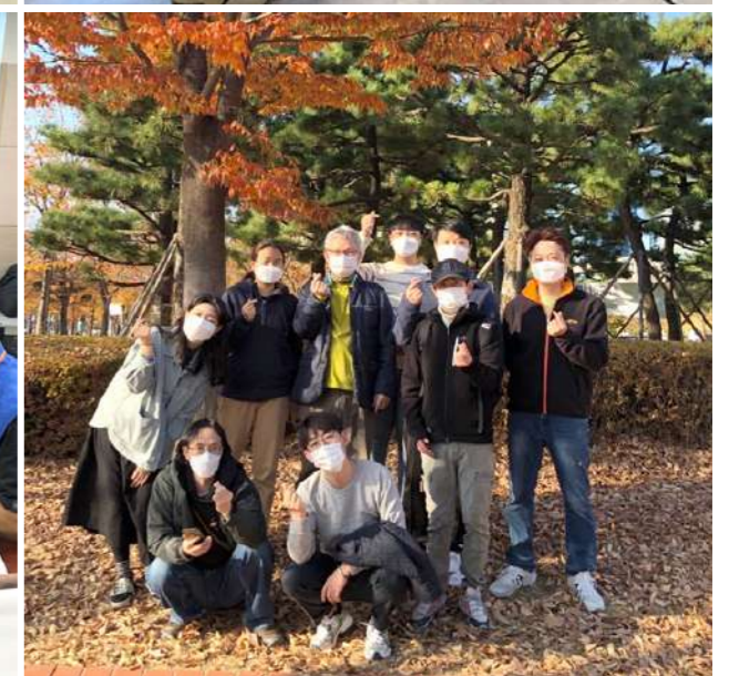
① 사진촬영 프로그램 '우리가 만드는 초점 : 포커스' 활동사진 ② 의용소방대, 방역하는 모습 ③ 한수원 시니어 봉사단의 모습 ④ 이용자분들과 함께한 가을 야외활동