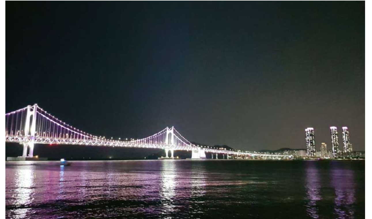
문화예술지원사업 '우리가 만드는 초점 : 포커스' 사진 촬영 프로그램 이용자 류동현 작품

어두운 밤이 찾아오더라도, 작지만 환한 빛으로. 어두운 밤이라도, 아름다울 수 있도록. - Editor E.W