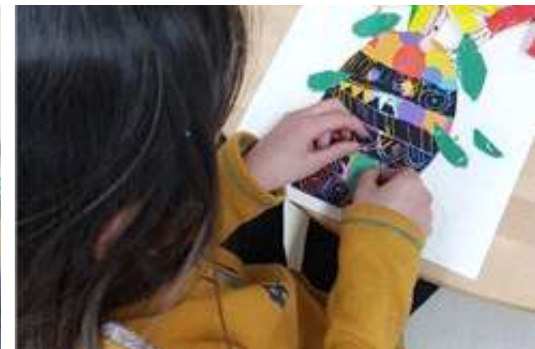
1 2 3